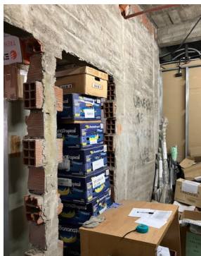
Sector oficina piso 1°