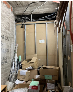
Sector oficina piso 1°

Foto a título ilustrativo de los sectores de intervención